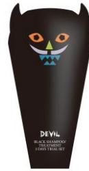
ロレッタ デビル ブラックヘアケア シリーズ トライアルセット

サンプリング内容： 2015年6月3日に新発売となった「ロレッタ デビル」のブラックヘアケアシリーズのシャンプー&トリートメント(パウチサンプル)が入った3日間のトライアルセットです。