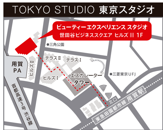
この地図の作成に当たっては、国土地理院長の承認を得て、同院発行の2万5千分の1地形図を使用した。(承認番号 甲25情保 第338-GISMAP36082号)

※セミナー当日は、開始10分前には会場へお越しください。 緊急時のご連絡は上記番号の株式会社ビューティーエクスペリエンス 教育企画課まで