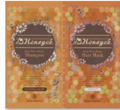
トラベルにも便利 1day お試し