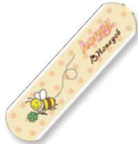
ハニーチェオリジナル honey さん絆創膏