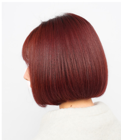
第一弾：ベリーベリーピンク ワンメイク(ブリーチあり)