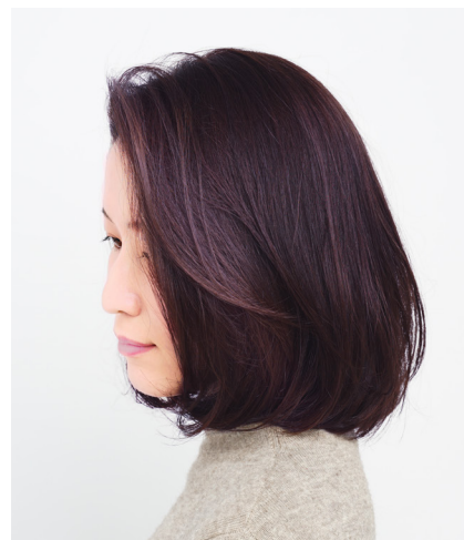
第二弾：ロイヤルパープル ワンメイク(ブリーチなし)